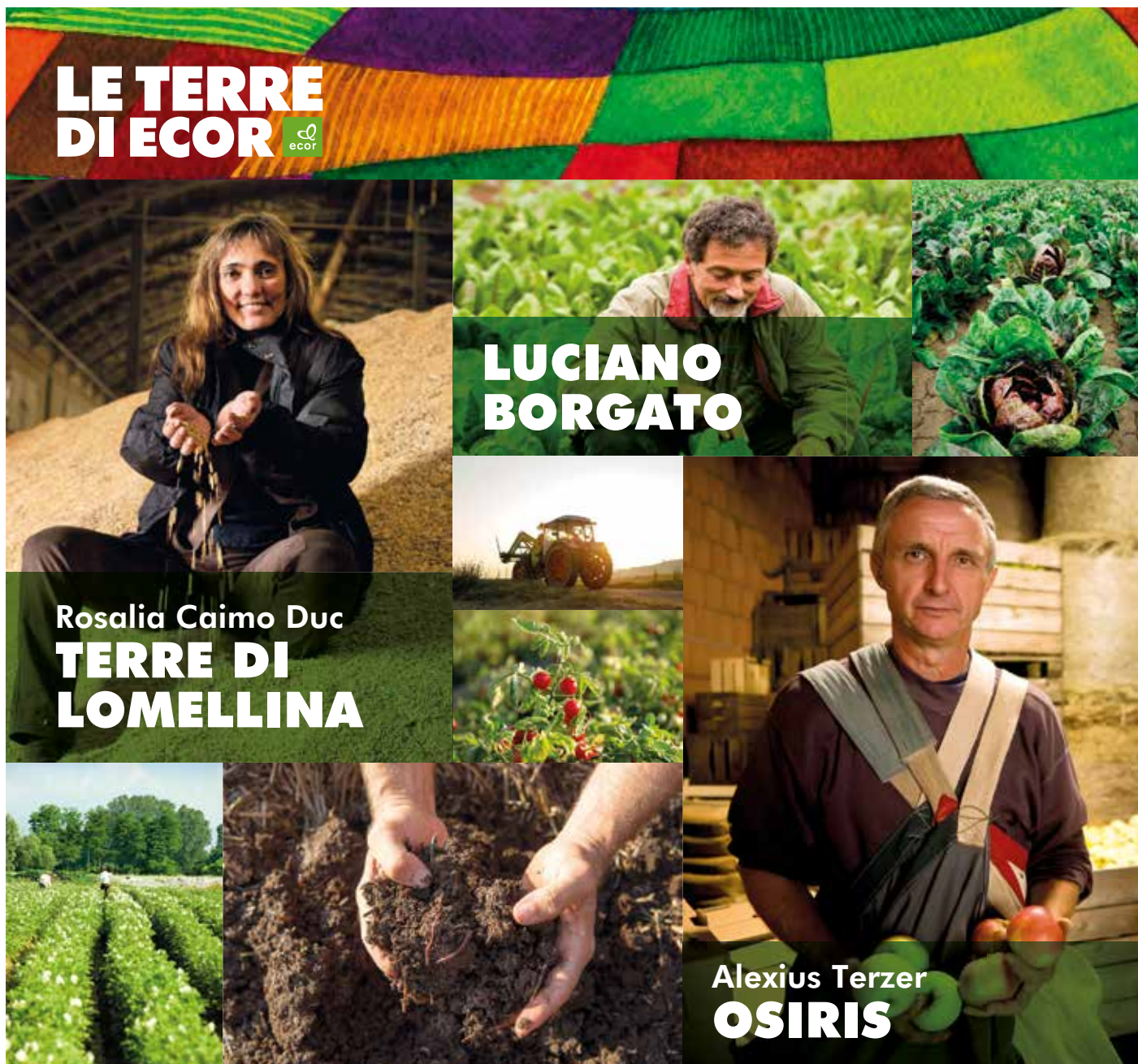
Rosalia Caimo Duc TERRE DI LOMELLINA